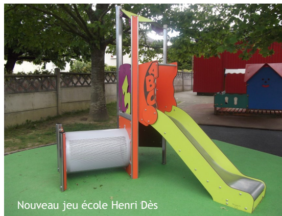
Nouveau jeu école Henri Dès