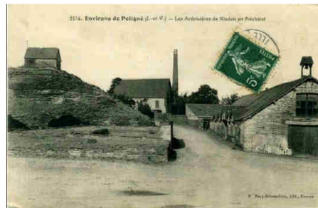
Carte ancienne

Ouvertes au 18 e siècle ce n'est qu'au cours du 19 e que les carrières se développèrent.