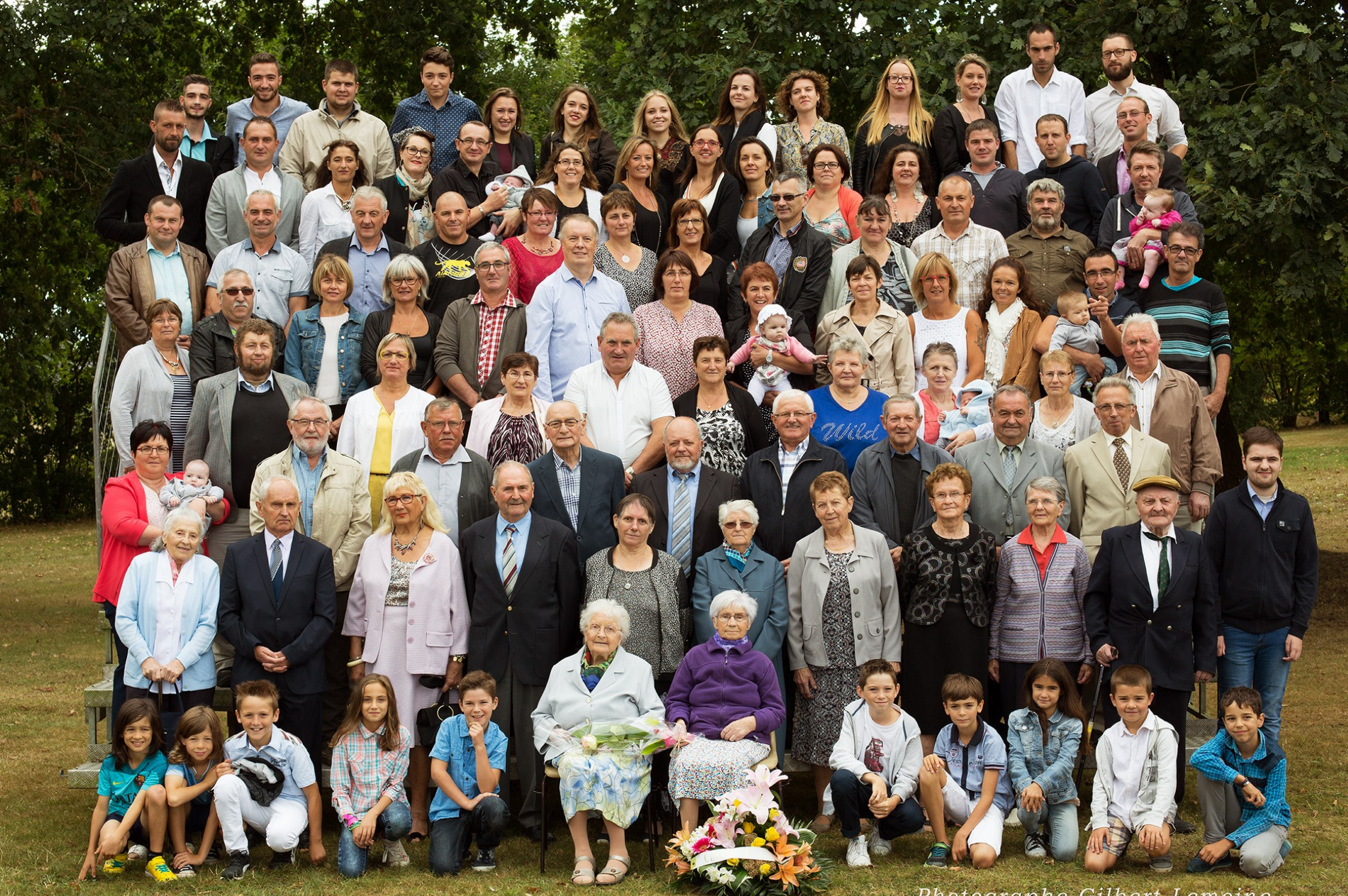
Classes 6 - Pléchâtel 2016