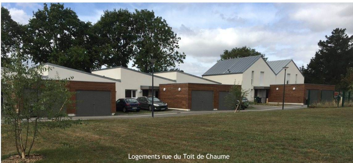
Logements rue du Toit de Chaume