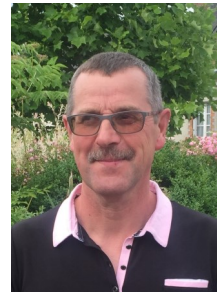
Xavier GÉRARD La Chapelle de Bagaron